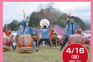
箕輪城太鼓保存会