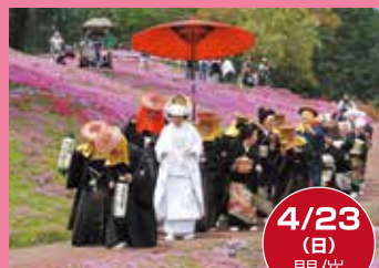
みのわの里の きつねの嫁入り出前行列

準備完了後、配布場所の案内放送をいたします。 放送後先着順とさせていただきます。※入場順ではありません。