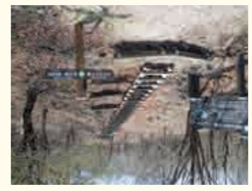
天目山 (榛名富士山頂より)

か足元に広がり、雄大な景色を望める。道を少し外れて沼の原まで足を運べば、春にはツツシの群落、とることができる。高原の涼風がすがすがしく、榛名公園